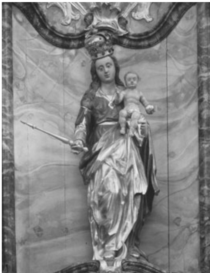
Rosenkranzkönigin mit Jesus-Kind von Franz Hauser (1702), Kirchzarten

❖ Wer schon täglich den Rosenkranz betet, sollte auch den nächsthöheren Schritt wagen, der darin besteht, dass wir das geheimnisvolle Leben Jesu in den eigenen Alltag mit einbeziehen! Die Kürze dieser Form des Rosenkranzes trägt dazu bei, die Familie im Gebet zu einen und zu umschließen. Daher können auch schon Kleinkinder angemeldet werden, wenn die Eltern (in Gegenwart des Kindes!, auch dann, wenn das Kleinkind schlafen sollte) das Gesätz stellvertretend für das Kind täglich beten. So wächst Ihr Kind schon früh in „sein“ Geheimnis hinein!