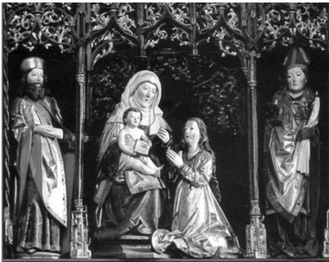
ANNENALTAR in der Marienkirche Gelnhausen

Die Figuren des Annen-Altars in Gelnhausen und die Annaselbdritt in Frankfurt sind kostbar gefasst. Eine goldfarbene Ausstattung kennzeichnet sowohl die Gestalten des hl. Joachim, des hl. Augustinus, der Mutter Anna und im Besonderen der Jungfrau Maria. Das kann als Ausdruck des Glaubens an die überzeitliche Gegenwart des Heilsgeschehens verstanden werden.