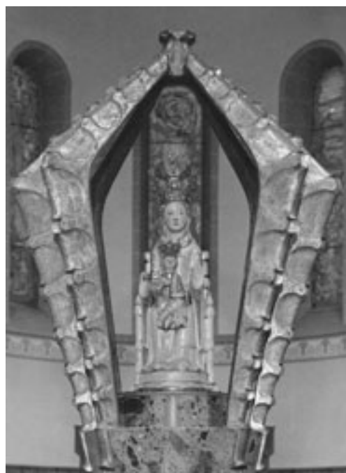
Gnadenbild von Werl

Provinzial des Dominikanerordens erhält. Im Verlauf der Zeit entstanden weitere Rosenkranzgemeinschaften: Rosenkranzkreuzzug des Dominikanerordens (1939); Familienrosenkranz (1942); der in Europa nebst dem Lebendigen Rosenkranz wohl bekannteste Sühnerosenkranz um den Frieden in der Welt (Wien 1949) und einige Rosenkranzbruderschaften .