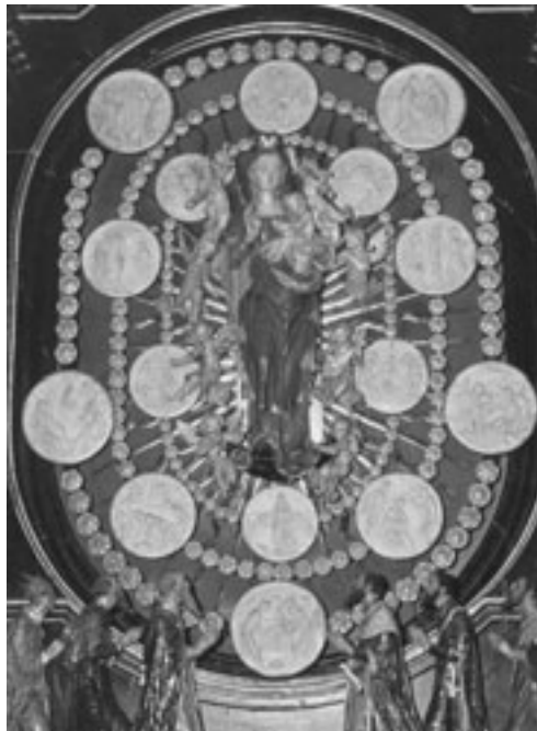
Rosenkranzaltar, St. Walburga, Werl