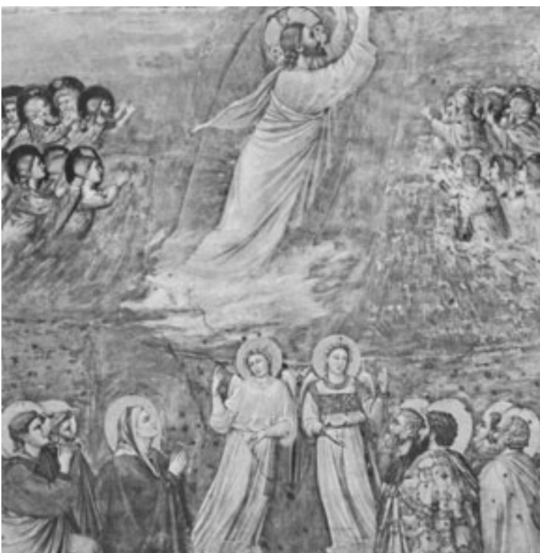
Giotto, Himmelfahrt Christi, Padua

Himmels macht. Wo der Mensch Gott in seinem Leben Gott sein lässt, dort wird der Mensch groß. Wo aber der Mensch sich selbst zu Gott macht, dort verliert er Wert und Würde. „Er stürzt die Mächtigen vom Thron“ (Lk 1,42), singt Maria im Magnifikat. Haben wir das nicht alle in den letzten 50 Jahren hier im Land und in ganz Mittel- und Osteuropa erlebt, wo man eine Zivilisation ohne Gott aufgebaut hat und der Mensch dabei verloren ging? Der Mensch hatte seine Krone als Kind Gottes und seine Würde als Schwester und Bruder