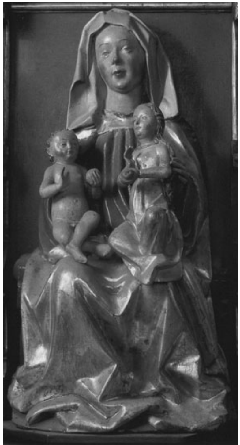
ANNASELBDRITT in der Anbetungskapelle der Liebfrauenkirche Frankfurt am Main

(Lk. 1, 35) Maria zeigt, welche Haltung des Menschen diesem Kind gegenüber angemessen ist. Die an den Fingerspitzen zusammengelegten Hände, eine der möglichen Gesten beim Gebet, können ein Ausdruck sein für die freiwillig dargebotenen Hände, die sich von Gott fesseln und in Dienst nehmen lassen. Es liegt sicherlich nahe, in der Haltung der Jungfrau Maria auch den Ausdruck der Fürbitte für die Menschheit zu sehen. Vorrangig ist hier aber, den wesentlichen Abstand von Schöpfer und Geschöpf zum Ausdruck zu bringen. Maria ist als Geschöpf das natürliche Kind ihrer Eltern.