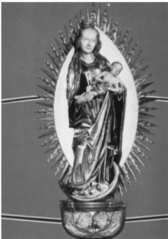
Madonna, Schlosskirche in Schleiden, Eifel